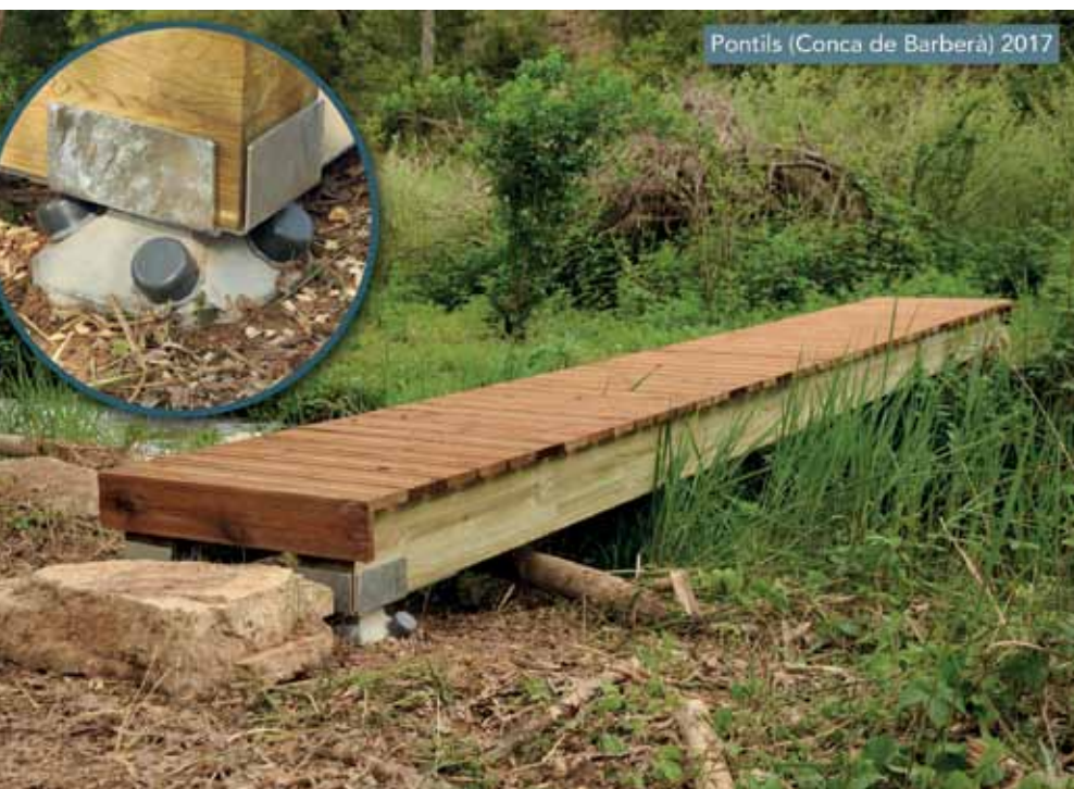
Cimentación para escuela de Surf en la playa de Hossegor, Biarritz, Francia. (Imagen superior). Cimentación para colocación de pasarelas en ruta senderista en un entorno protegido. (Imagen inferior). Cimentación del edificio Möbius en San Sebastián. (En la primera página).

contacto con nosotros, los formamos para que pudieran realizar la instalación ellos mismos; los medios para llegar al lugar de emplazamiento eran complicados por lo